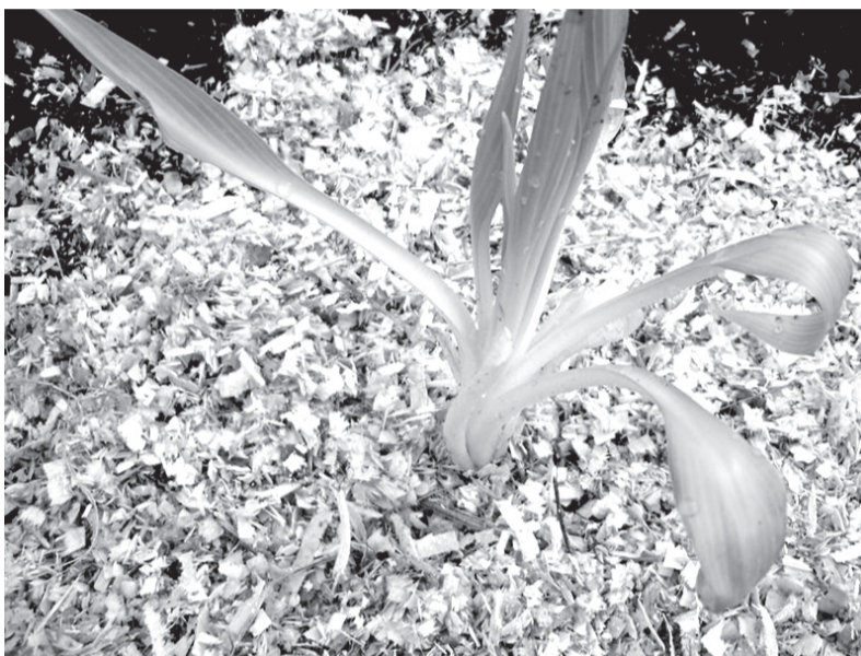
Опилки - и удобрение, и защита для растений

Кстати, из опилок получается отличная мульча. Мы с женой толстым слоем мульчируем с осени озимый чеснок и прочие подзимние посевы, клумбы. Весной опилки сгребаем, чтобы быстрее появились всходы. Кстати, в мульчу, используемую для клумб, добавляем препараты против