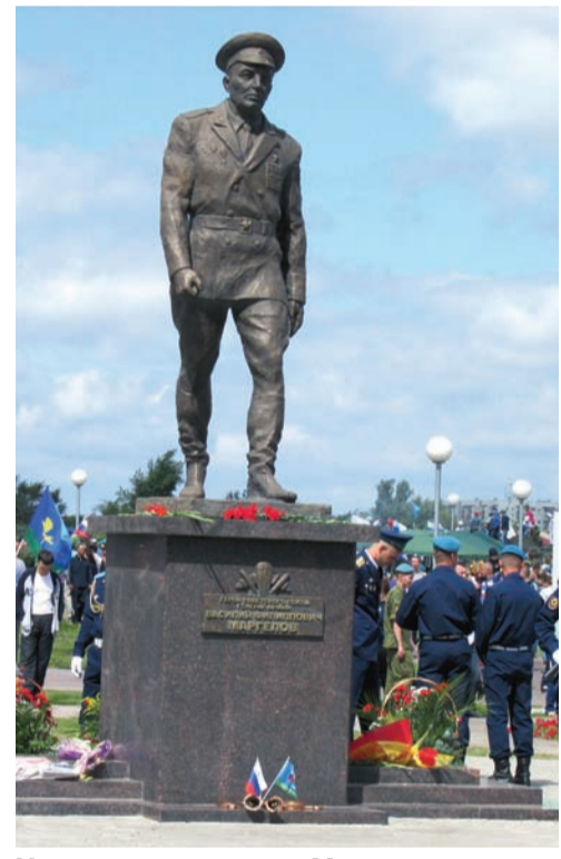
У памятника генералу Маргелову всегда свежие цветы

В минувшее воскресенье в Ульяновске отметили 85-летие со дня основания «крылатой пехоты» - Воздушно-десантных войск. Масштабные мероприятия развернулись на территории 31-й отдельной десантно-штурмовой бригады и в парке имени Генерала Маргелова. Гостями праздника стали первые лица города и области, ветераны, представители общественных организаций, а также все, кто когда-либо служил в рядах «крылатой пехоты».