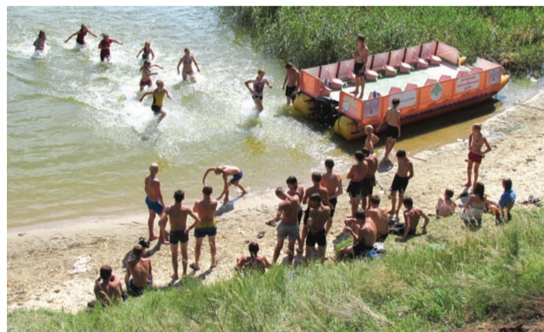
Пляж - любимое место «островитян»

Тот день как раз был банным, и вокруг палатки копошились ребята, разводя огонь. Часть мальчишек отправилась в лес за вениками. А у остальных день шел своим чередом - занимались силовой подготовкой, бегали, играли в волейбол, плавали. Кое-кто из девочек наводил порядок в палатках, стирали одежду, помогали готовить