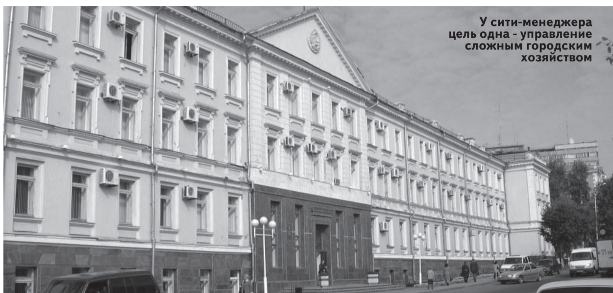
У сити-менеджера цель одна - управление сложным городским хозяйством

16 октября Ульяновске состоится конкурс на замещение должности главы администрации города.