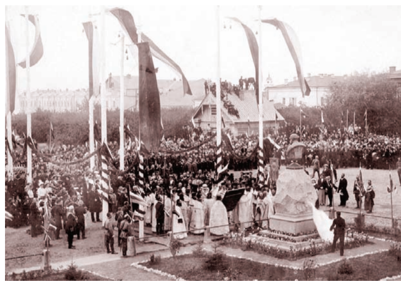
Открытие памятника П.А. Столыпину. 1913 г.

С авторством бюста Гончарова много непонятного. Как рассказывает краевед Сергей Петров, который провел целое расследование, в паспорте на эту работу в Министерстве культуры РФ указан Леопольд Бернштам. Это был известный мастер, любимый скульптор Николая II, эмигрировавший из России в конце XIX века. Однако в Ульяновске многие убеждены, что бюст изваял