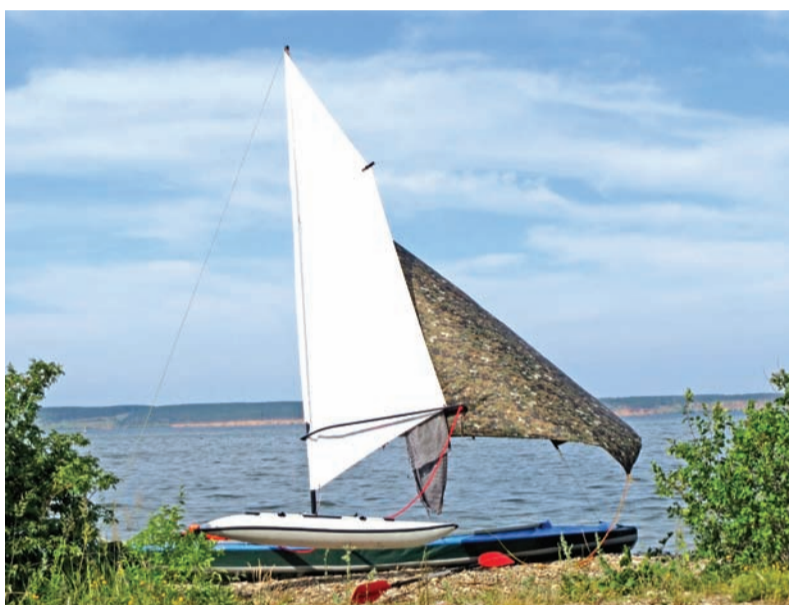
Парусная байдарка «Таймень-3» - основное средство передвижения участников фольклорной экспедиции по Волге

- Конечно, исполняются они с различными, интересными вариациями. Забавно, что почти в