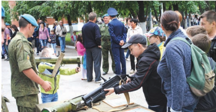
Юные ульяновцы живо интересовались новыми образцами стрелкового оружия

По завершении вечера многие юноши и девушки решили продолжить общение. Наверняка между кем-то завяжутся отношения, которые могут перерасти в настоящую любовь, и ЗАГС «Солнечный» вновь примет под свои своды романтическую пару уже как молодоженов. Кстати, за три года существования в Ульяновске клуба знакомств там познакомились свыше 500 пар, из них восемь оформили отношения.