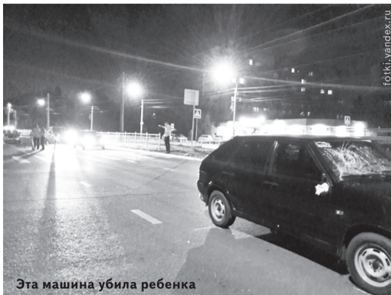
Эта машина убила ребенка

Нелепо оборвавшаяся юная жизнь заставляет вновь напомнить водителям о необходи-