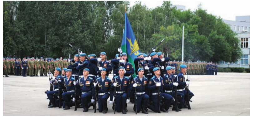
Каре на плацу - высший пилотаж строевой подготовки