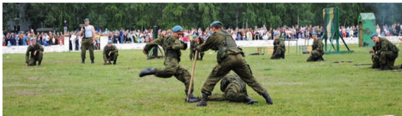
Показательные выступления по рукопашному бою бойцов 31-й бригады