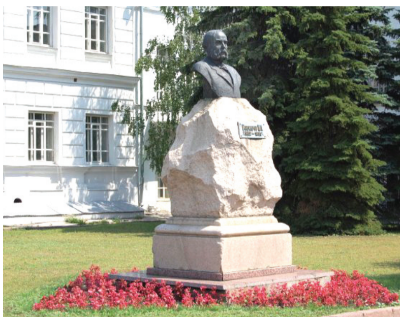
Бюст Гончарова у Дворца книги

О том, что нужно поставить бюст Столыпина на его законное место, краеведы начали говорить с начала 1990-х годов. Идея нашла как своих сторонников, так и противников. Последние аргументируют свою позицию, в частности, тем, что горожане привыкли к существующему месту нахождения бюста Гончарова, кроме того, сама личность Столыпина и результаты его деятельности историками оце-