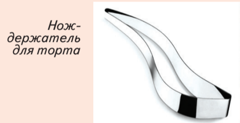
Нож-держатель для торта