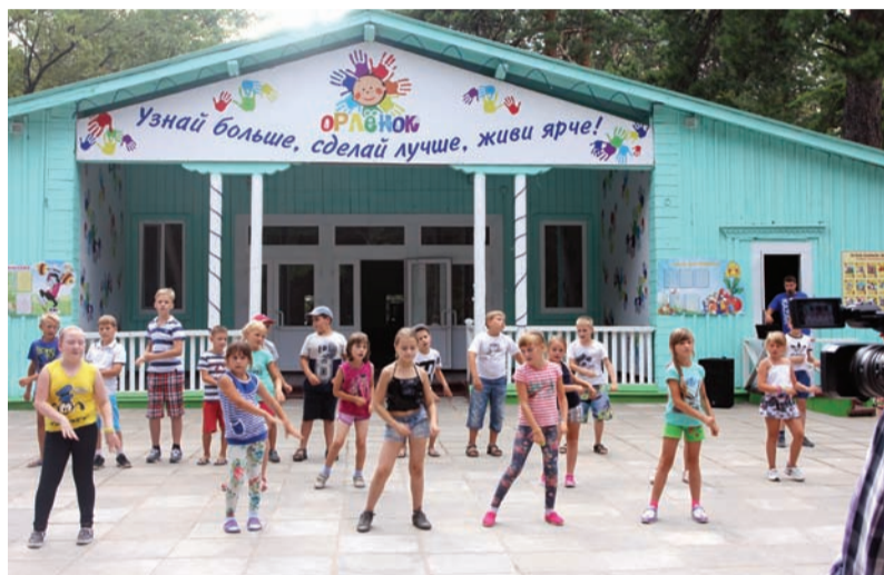
«Орлята» учатся летать

На прошлой неделе в детском оздоровительном лагере «Орленок» стартовала третья летняя смена.