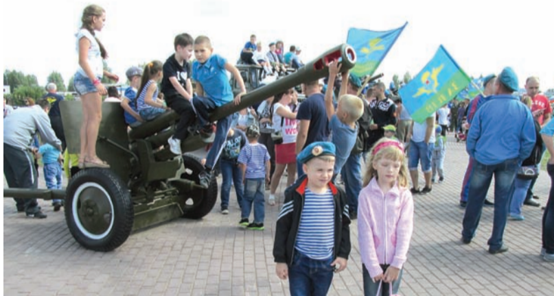
Служить Родине и быть мужчиной учимся с детства!